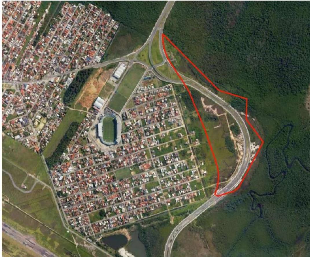
Figura 2. Área de Estudo Ambiental (AEA) identificada pelo polígono em vermelho

Fundação Municipal do Meio Ambiente DIRETORIA DE LICENCIAMENTO AMBIENTAL - DILIC Rua Quatorze de Julho, nº 375, Estreito, Florianópolis/SC, CEP: 88075-010 Contato: delicfloram.smma@pmf.sc.gov.br | (48) 3271-6800